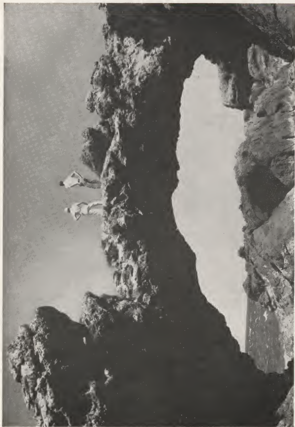
One of the so-called "Natural Bridges" at Andicuri, Aruba